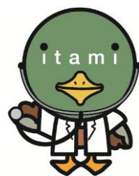
伊丹市マスコット たみまる