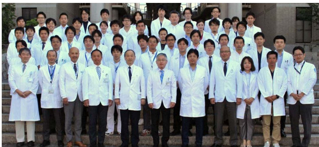
医局員集合写真（2017 年）

豊富な症例数に基づいた研修により、運動器全般に関する的確な診断能力を身につけ、適切な保存療法、リハビリテーションを実践する。さらに基本手技から最先端技術までを網羅した手術治療を実践することで、運動器疾患に関する 良質 かつ 安全 な医療を提供する。