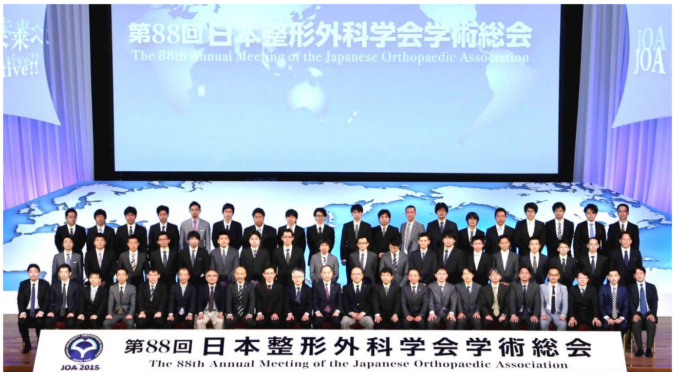
医局員集合写真（2015年）

指導医はその受講記録を整形外科専門研修プログラム管理委員会に提出し、同委員会はサイトビジットの時に提出できるようにします。受講記録は日本整形外科学会でも保存されます。