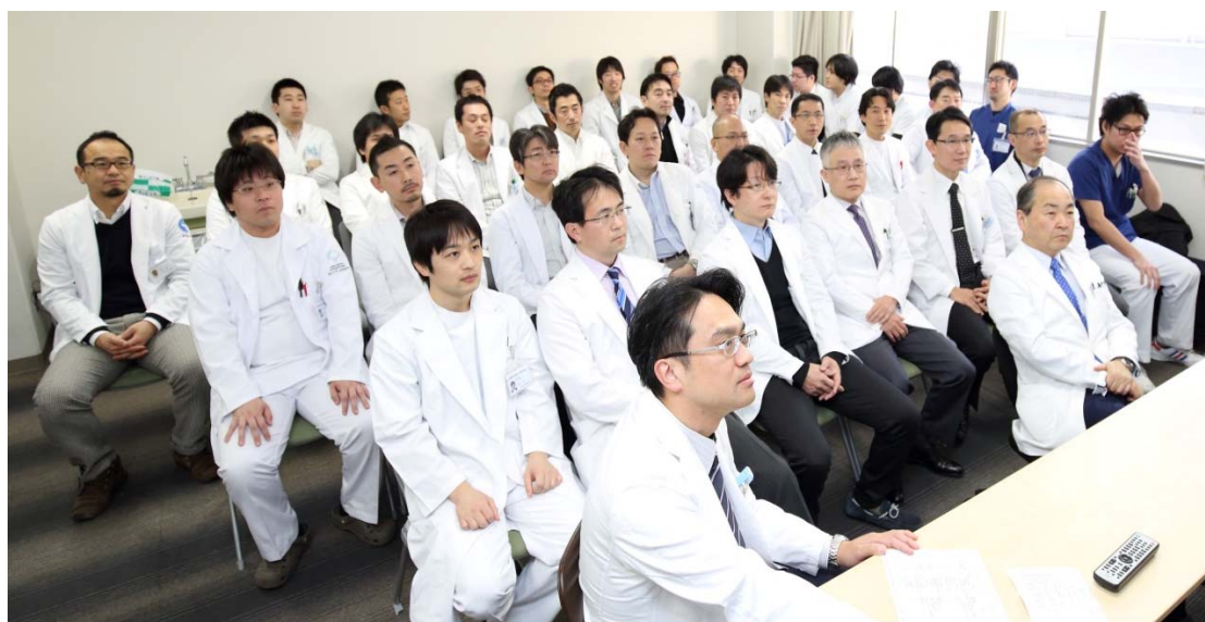
病棟カンファレンス（2015年）

専門研修プログラムの移動に際しては、移動前・後のプログラム統括責任者及び整形外科領域の研修委員会の同意が必要です。