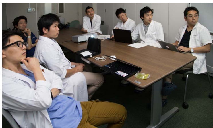
リサーチプログレス（研究進捗検討会）

専攻医は、整形外科研修カリキュラムに沿って研修し、整形外科専門医として、あらゆる運動器に関する幅広い基本的な専門技能（診察、検査、診断、処置、手術など）を身につけます。日本整形外科学会ホームページ掲載の資料2： 専門技能修得の年時毎の到達目標 に年時毎の到達目標が記されています。