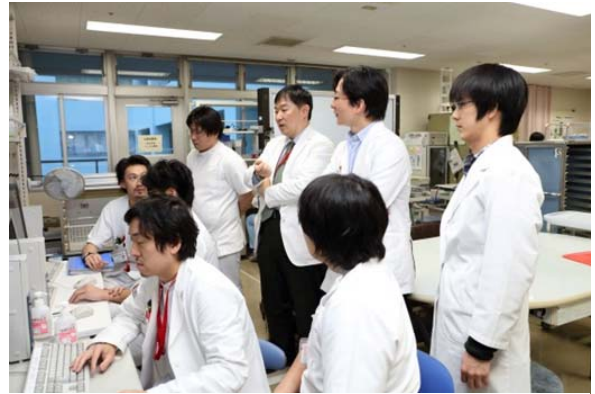
病棟での日常診療

専攻医に対する評価判定に他職種（看護師、技師等）の医療従事者の意見も加えて医師としての全体的な評価を行い、 資料10：専攻医評価表 （日本整形外科学会ホームページ参照）に記入します。専攻医評価表には指導医名以外に医療従事者代表者名を記します。