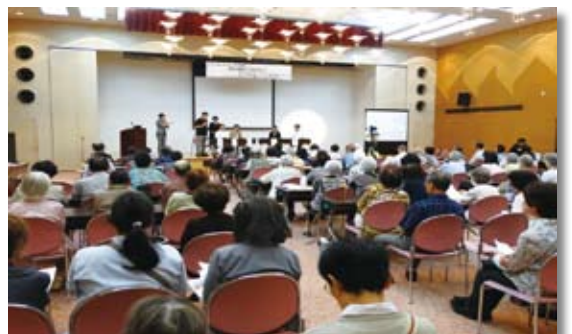
昨年の市民公開講座の様子