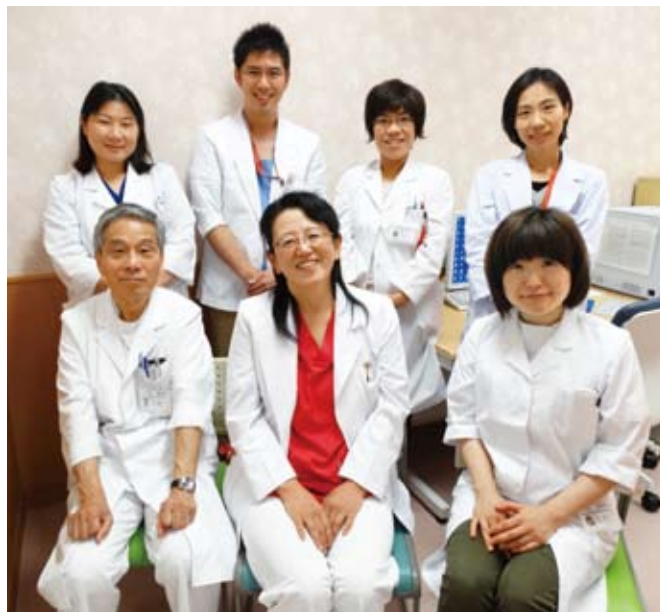
産婦人科スタッフ全員、力をあわせてがんばります！