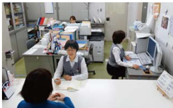
丁寧な受付対応で安心して受診できます