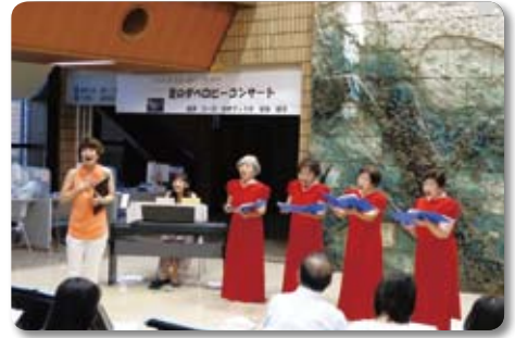
昨年のロビーコンサートの様子

日時:平成27年9月5日(土) 15時~16時 場所:市立伊丹病院 1階ロビー 出演:コーロ・あまでゆうす 参加費:無料 主催:患者サービス向上委員会