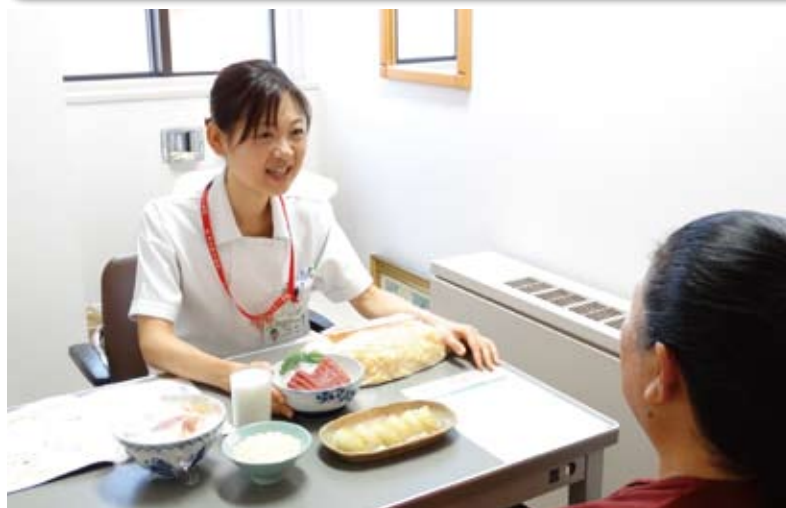
年に一度は健康状態のチェックを