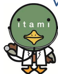
伊丹市マスコット たみまる

お問い合わせ 市立伊丹病院 広報担当 TEL 072-777-3773 (平日 9:00～17:00)