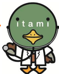
伊丹市マスコット たみまる