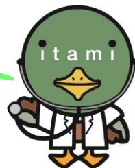
伊丹市マスコット たみまる