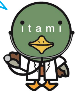
伊丹市マスコット たみまる