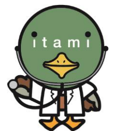
伊丹市マスコット たみまる