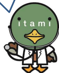
伊丹市マスコット たみまる

お問い合わせ: 市立伊丹病院 広報担当 072-777-3773 (平日 9:00~17:00)