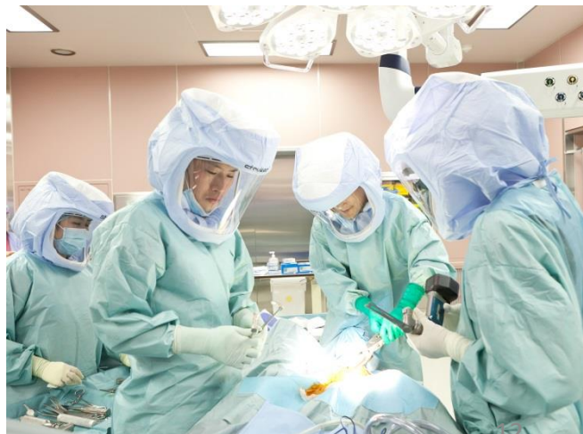
手術の見学もできます♪