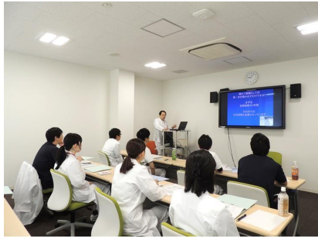
1年目研修医の勉強会