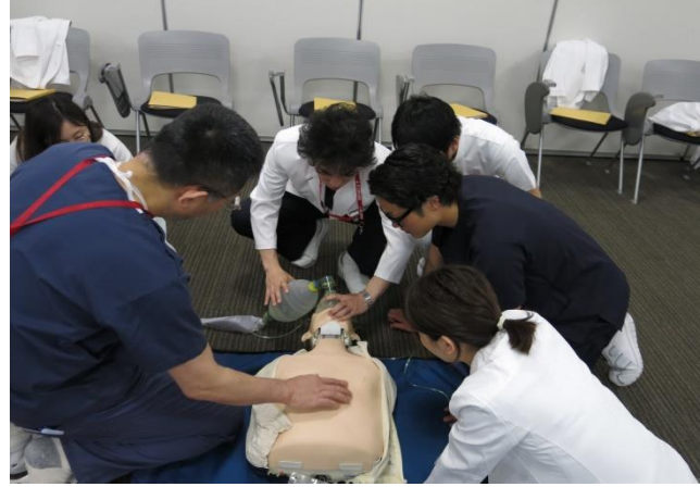
1年目研修医オリエンテーション BLS研修