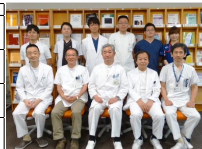
女性医師も活躍中