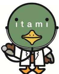
伊丹市マスコット たみまる